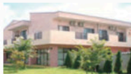
とくべつようごろうじん ホーム ホームタウンほそや