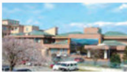
かいごろうじんほけんしせつ ケア・ステージ氏家