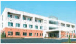
かいごろうじんほけんしせつ 同仁苑