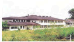
とくべつようごろうじん ホーム 那須順天荘