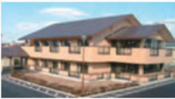
ぐるーぷほーむ 宇都宮