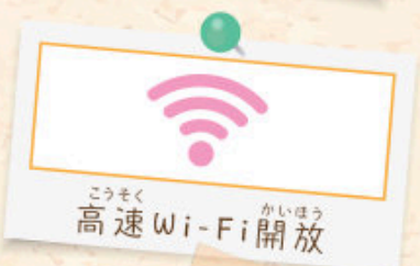
こうそく かいほう 高速Wi-Fi開放

ほんこう しゃ きょういくきかんむ 本校では、Google社が教育機関向 けに提供しているクラウド型オンライ ン学習ツールを利用し、ICT教育を すすめていきます。