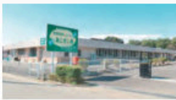
とくべつようごろうじん ホーム あじさい苑