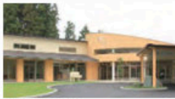
たきのうがたぎやうじしよ ひびき