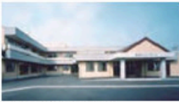
かいごろうじんほけんしせつ たかねざわ