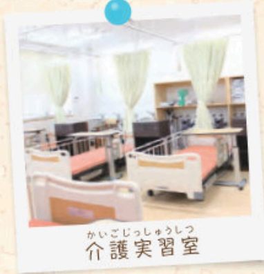
かいごじっしゅうしつ 介護実習室