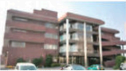
かいごろうじんほけんしせつ 宇都宮