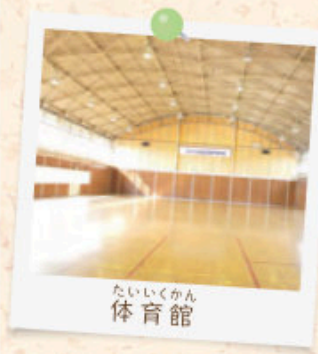
たいいくかん 体育館

ぜんきょうしつ しよう こう 全教室で使用できる高 速Wi-Fiを学生用に開放 しています。