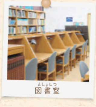
としょしつ 図書室