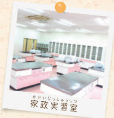
かせいじっしゅうしつ 家政実習室