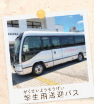
がくせいようそうげい 学生用送迎バス