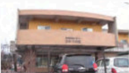
とくべつようごろうじん ホーム ひかりの里