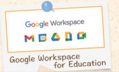
Google Workspace for Education

ほんこう しゃ きょういくきかんむ 本校では、Google社が教育機関向 けに提供しているクラウド型オンライ ン学習ツールを利用し、ICT教育を すすめていきます。