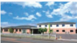
サービス付き高齢者向け住宅 インマイライフさくら氏家