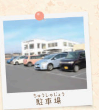
ちゅうしゃじょう 駐車場