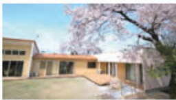
こどもはつたつせんたー びーち