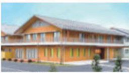
とくべつようごろうじん ホーム フローラりんくる