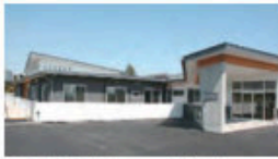
とくべつようごろうじん ホーム 晴風園