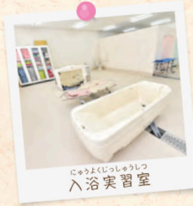
にゅうよくじっしゅうしつ 入浴実習室