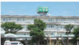
かいごろうじんほけんしせつ いずみ